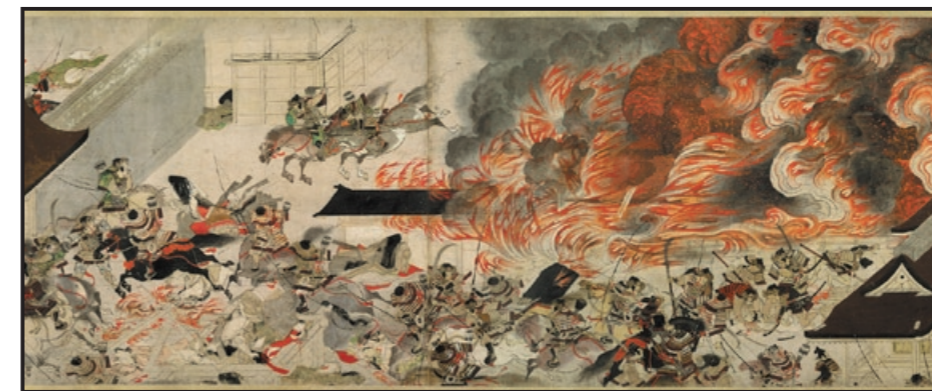
③「平治物語絵巻(三条殿夜討巻)」(部分) Night Attack on the Sanjo Palace, from the Illustrated Scrolls of the Events of the Heiji Era (Heiji monogatari emaki) 鎌倉時代(13世紀)、紙本着色1巻、41.3 × 699.7cm、画像番号11.4000 他に「信西巻」は静嘉堂文庫美術館、「六波羅行幸巻」は東京国立博物館の所蔵。 Fenollosa-Weld Collection, 11.4000 / 2008©Museum of Fine Arts, Boston c/o DNPpartcom

1876年に開館したボストン美術館は、メトロポリタン美術館(NY)、ワシントン・ナショナル・ギャラリーと並び、アメリカ三大美術館に数えられています。コレクションの内容は幅広く、エジプト、ヨーロッパ、アメリカ、さらに世界有数の東洋美術部門の日本美術の名品など約40万点を収蔵しています。 http://www.mfa.org/