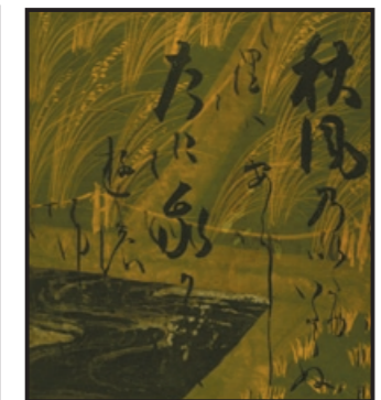
⑨俵屋宗達・本阿弥光悦「四季草花下絵和歌色紙帖」 Album mit Waka-Gedichten auf Bildern von Blumen und Gräsern der Vier Jahreszeiten 江戸時代(17世紀初)、紙本金銀泥絵墨書、18.3 × 16.2cm、画像番号00028542