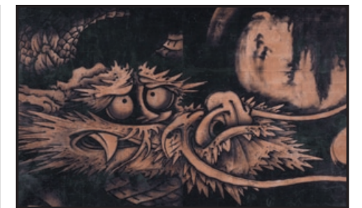
④曾我蕭白「雲龍図」(部分) Dragon and Clouds 江戸時代(1763)、紙本墨画 まくり四枚(もと襖八面)、各165.2 × 270.7cm、画像番号11.7042 William Sturgis Bigelow Collection, 11.7042 / 2008©Museum of Fine Arts, Boston c/o DNPpartcom