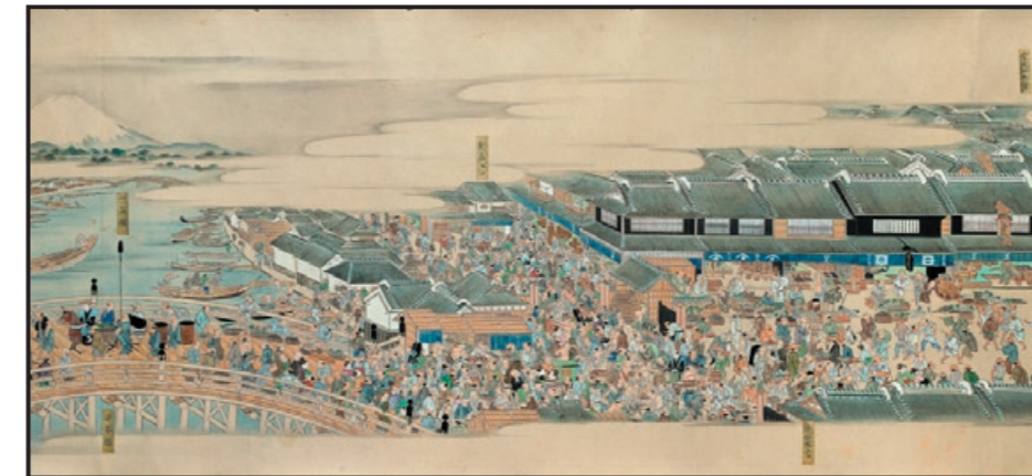
⑧「熙代勝覧」(部分) Kidai Shōran: Vortrefflicher Anblick unseres prosperierenden Zeitalters 江戸時代(1805頃)、紙本着色1巻、43.7 × 1232.2cm、画像番号00073117

1889年、実業家エミール・ギメによりパリに開設されたギメ美術館は、ギメの日本、中国、インドを含む世界周遊の旅の成果を基礎として、東洋美術の収集を続けてきました。1945年には、ルーヴル美術館のアジア美術部門の作品全部を受け入れ、以来、ギメ美術館はアジア美術品を展示する世界でも有数の美術館の一つとなっています。 http://www.guimet.fr/-rubrique4-