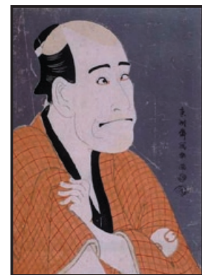
⑤東洲高写案「嵐龍蔵の金貨石部金吉」 Portrait d'acteur de kabuki (okubi-e) : l'acteur Arashi Ryūzō, pièce 江戸時代(1794)、錦絵、37.0 × 24.5cm、画像番号00-021649