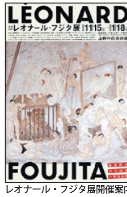
レオナルド・フジタ展開催案内

今後も当社では、画家や美術館とご利用者とを結ぶお手伝いをしてまいりますので、ぜひご活用ください。