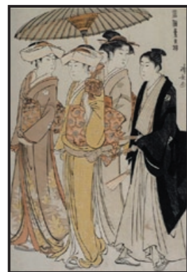
⑥鳥居清長「風俗東之錦(若侍を連れた武家息女の一行)」 Filles de samouraï accompagnées d'un jeune homme, série : modes populaires d'Edo 江戸時代(1783-84頃)、錦絵、37.5 × 25.0cm、画像番号00-021625