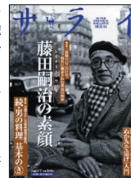
《サライ》2008 年 2 月 7 日号 特集: 藤田嗣治の素顔