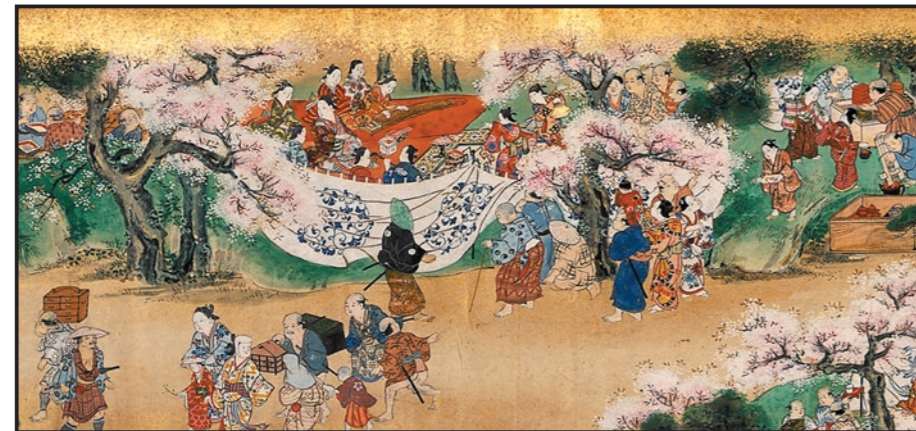
①「江戸風俗図巻・上野の図」(部分) Scenes of Daily Life in Edo: Ueno 江戸時代(享保年間1716-36)、紙本着色1巻、29.5 × 1066.5cm

1753年に創設され200年を越える歴史を誇る大英博物館は、世界中から毎年500万人の来館者を集める世界最大級の博物館です。先史時代から現代まで、全世界の美の遺産を集めた所蔵品は現在600万点に達し、人類の歴史のあらゆる時代を網羅しています。 http://www.britishmuseum.org/